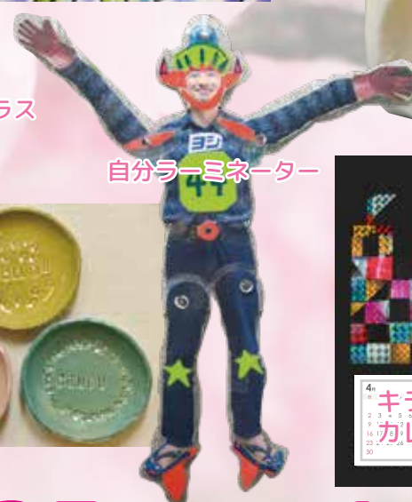
自分ラミネーター