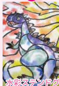
水彩スタンドグラス