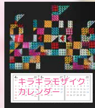
キラキラモザイク カレンダー