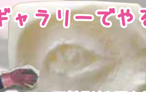
石鹸彫刻 眼を彫る